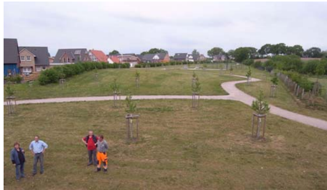
Bad Oldesloe Grünfläche Baugebiet ‚Steinfelder Redder‘