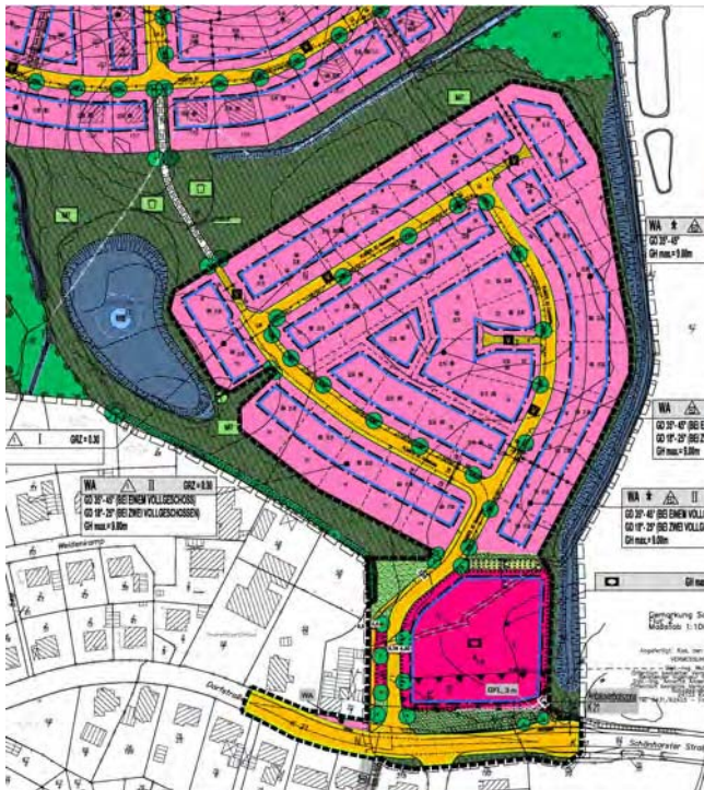
Bebauungsplan Schönkirchen ‚Rinkenberg Ost‘ inkl. Umweltbericht

Im Hinblick auf die Gesetzesänderungen durch das EAG Bau erlangt der Umweltbericht besonderes Gewicht. Der interdisziplinäre Charakter unseres Büros fördert die Koordination bei der Durchführung der Strategischen Umweltprüfung. Ein aktuelles Datenbank- und Informationsmanagement unterstützt unsere Planer darüber hinaus bei einer effektiven und rechtskonformen Erarbeitung der Unterlagen.