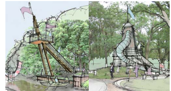
Grenzerlebnisstationen Bad Bentheim: Bsp. Aussichtsturm und Grenzrutsche

Beispielhaft wird hier das Projekt Aktivpark Grafenschaft Bad Bentheim ‚Grenzstationen‘ vorgestellt. Ziel ist es durch die Einrichtung von Groß(spiel)geräten die Grenze zu den Niederlanden erlebbar zu gestalten.