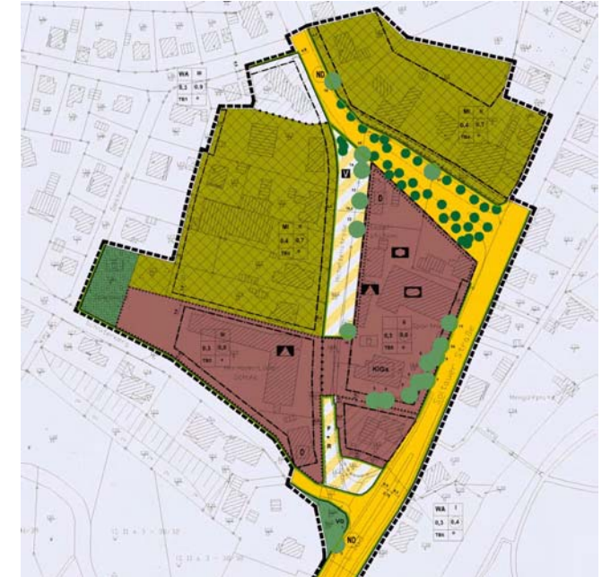
B-Plan Soltau Straße - Bad Fallingbostal