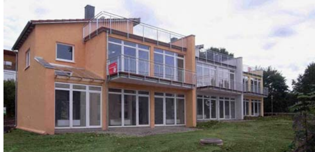
TriChalets für die Sparkasse Göttingen (Entwurf / Ausführung)