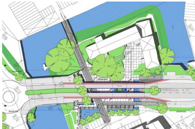
Buxtehude Sanierungsgebiet ‚Alter Hafen‘ – neue Hafenbrücke