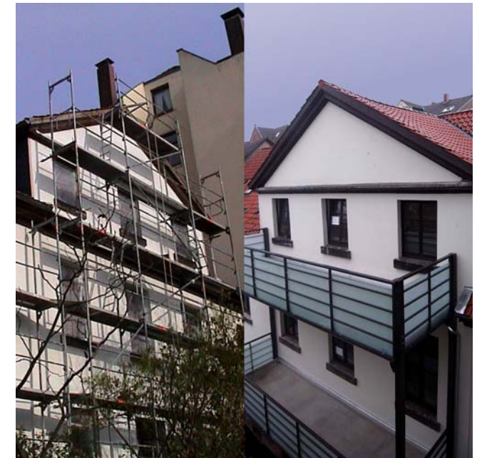
Altbautsanierung in Hannover-Linden

Für den Abgleich mit denkmalpflegerischen Aspekten bieten wir eine langjährige Erfahrung mit, die z.B. auch einen Balkonanbau an einem historischen Laves-Gebäude (siehe Bild) oder Umbauten an Ikonen der 'Hamburger Schule' ermöglichte.