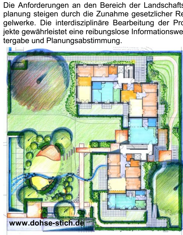
Entwurfsplanung Freiraum Wohnprojekt W.I.P

Die Anforderungen an den Bereich der Landschaftsplanung steigen durch die Zunahme gesetzlicher Regelwerke. Die interdisziplinäre Bearbeitung der Projekte gewährleistet eine reibungslose Informationsweitergabe und Planungsabstimmung.