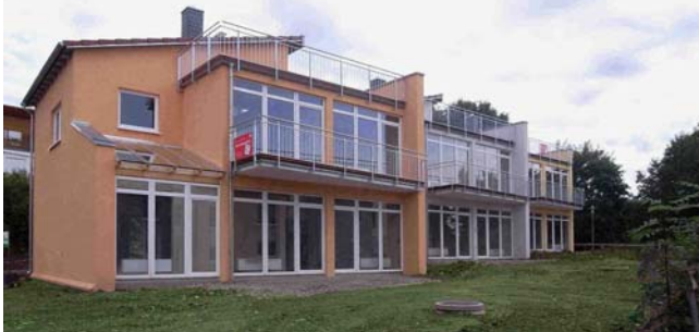
TriChalets für die Sparkasse Göttingen (Entwurf / Ausführung)