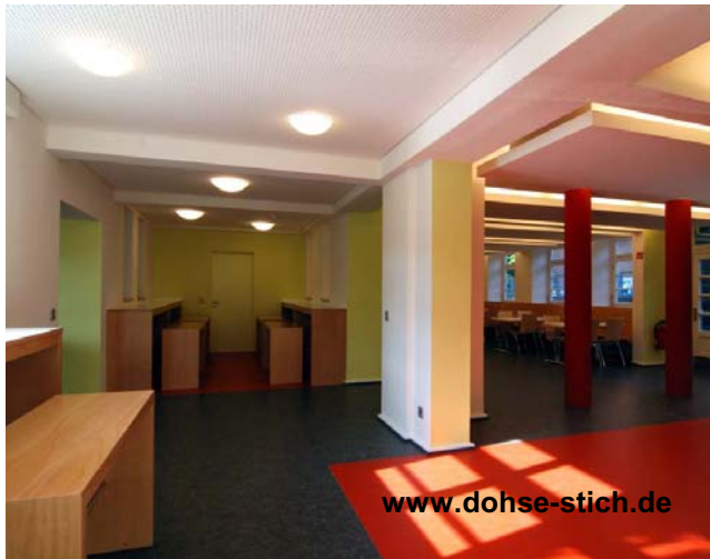
Umbau der Schule Benzenbergweg. Standort Langenfort

Jeder Raum verlangt durch seine Gegebenheiten eine ganz spezielle Behandlung in Hinblick auf die Gestaltung und die Verleihung eines unverwechselbaren Highlight. In einem Museum können dazu edlere Materialien benutzt werden. In den Schulkantinen mit einem festgelegten finanziellen Background reicht unter Umständen eine farbig gestaltete Wand oder ein Durchbruch in einer wichtigen Sichtachse.