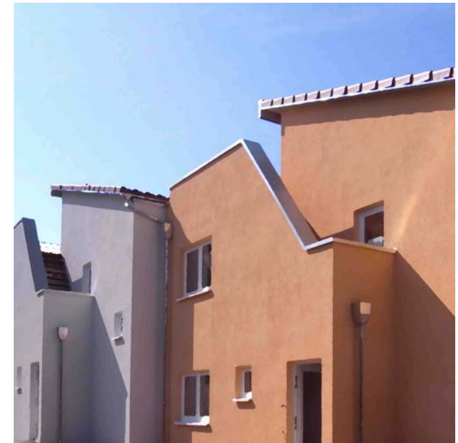
Reihenhäuser 'TriChalets' Zietenterrassen Göttingen