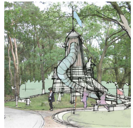
Beispiel Tourismuskonzept: Grenzstationen Bad Bentheim

Unser Augenmerk liegt auf der Entwicklung und Förderung von Maßnahmen in kleinen bis mittelgroßen Gemeinden und Städten in Norddeutschland. Hier ist neben der klassischen Stadt-, Bauleit- und Landschaftsplanung die Beratung, Moderation zwischen den Beteiligten oder Steuerung - z.B. von Sanierungs- oder Erschließungsmaßnahmen - ein besonderer zusätzlicher Schwerpunkt. Darüber hinaus sind wir im Hochbau vor allem in der Region Hannover bis Göttingen beschäftigt. Es gibt aber auch Projekte - wie zum Beispiel im Touristik-, Stadt- und Regionalmarketing - in denen der Rahmen größer gesteckt ist.